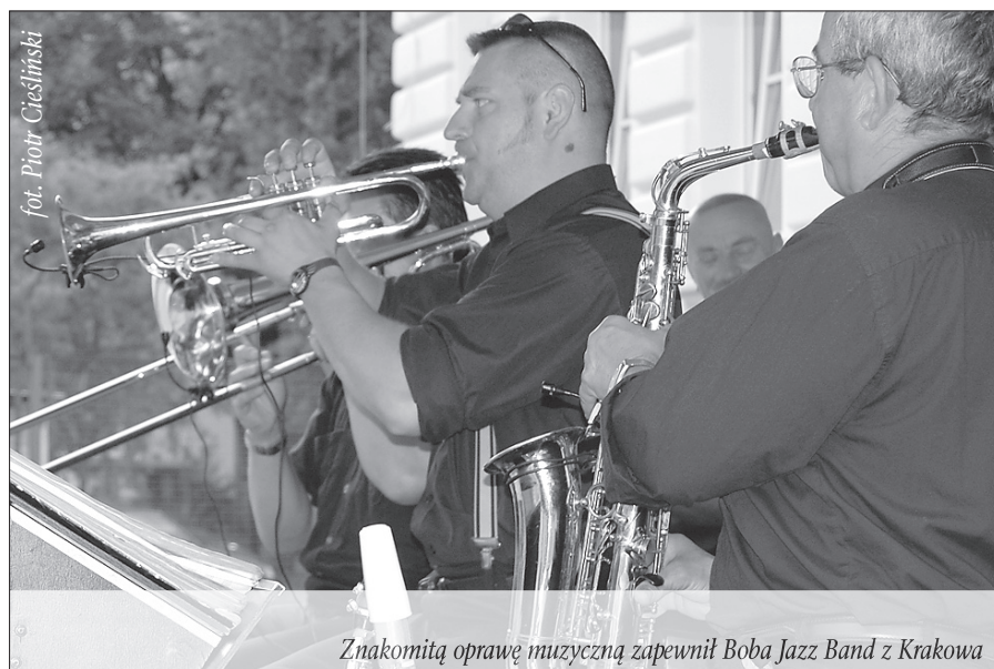
Znakomitą oprawę muzyczną zapewnił Boba Jazz Band z Krakowa

Wszystkim sponsorom składamy serdeczne podziękowania!