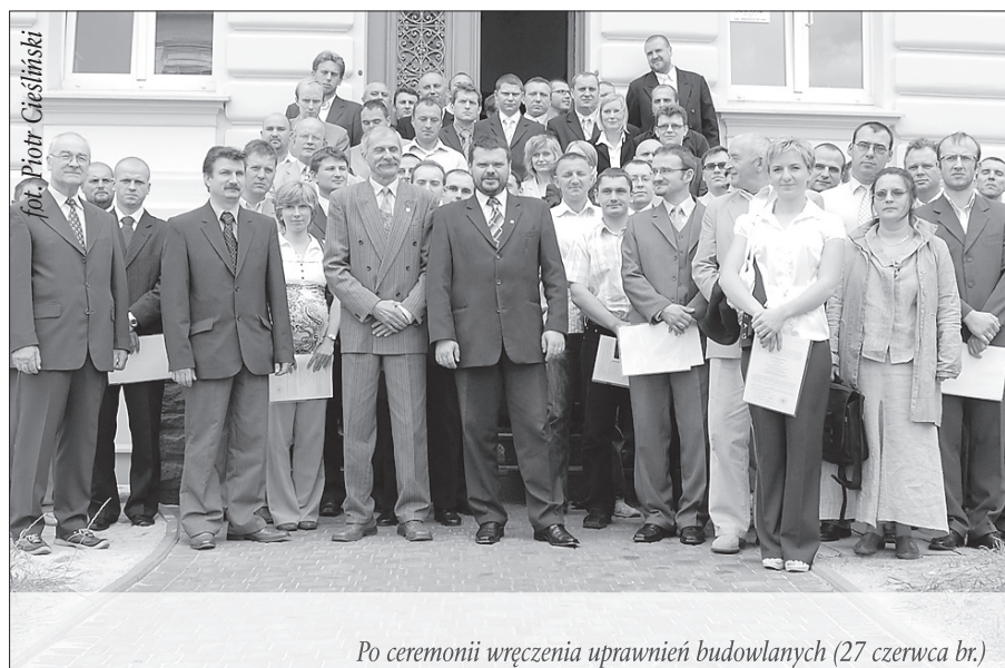
Po ceremonii wręczenia uprawnień budowlanych (27 czerwca br.)