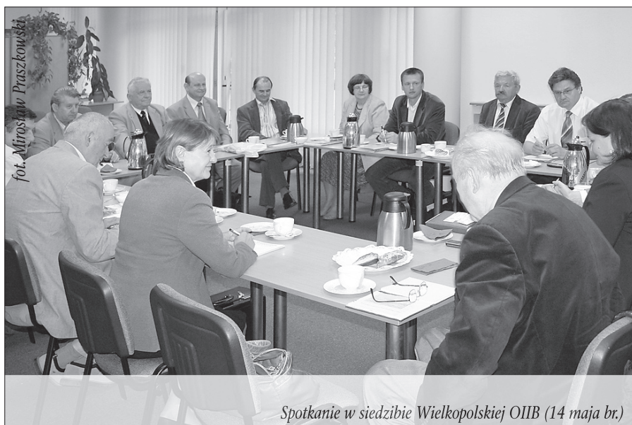
Spotkanie w siedzibie Wielkopolskiej OIIB (14 maja br.)