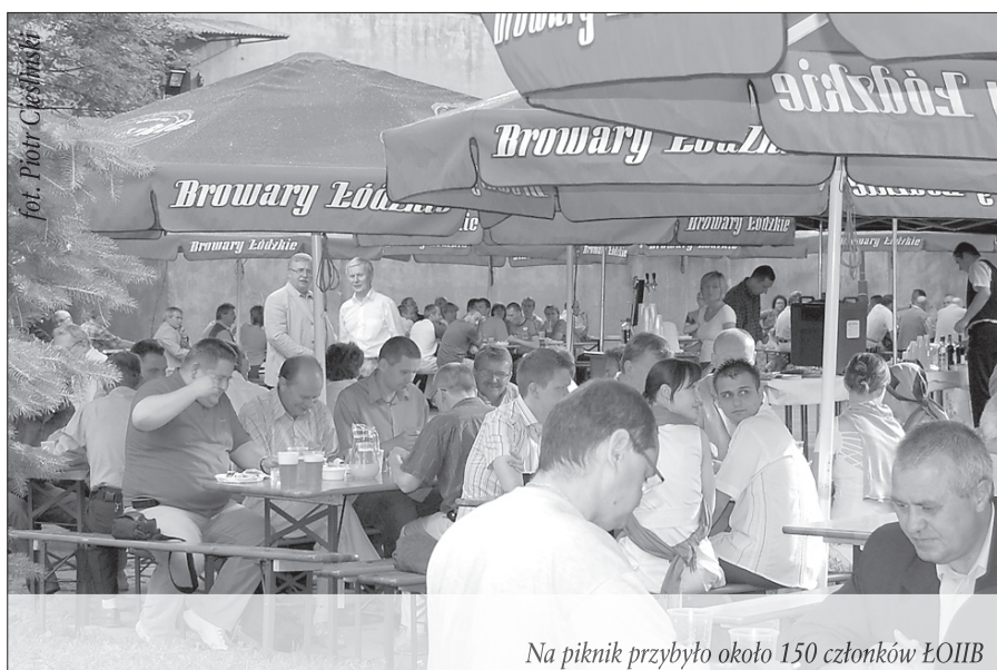
Na piknik przybyło około 150 członków ŁOIIB

cie wprowadzenie podczas uroczystego otwarcia VI Zjazdu Łódzkiej Okręgowej Izby Inżynierów Budownictwa, które miało miejsce 31 marca 2007 r. w historycznej sali obrad Urzędu Miasta Łodzi.