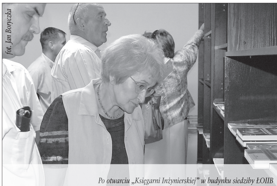
Po otwarciu „Księgarni Inżynierskiej” w budynku siedziby ŁOIIB